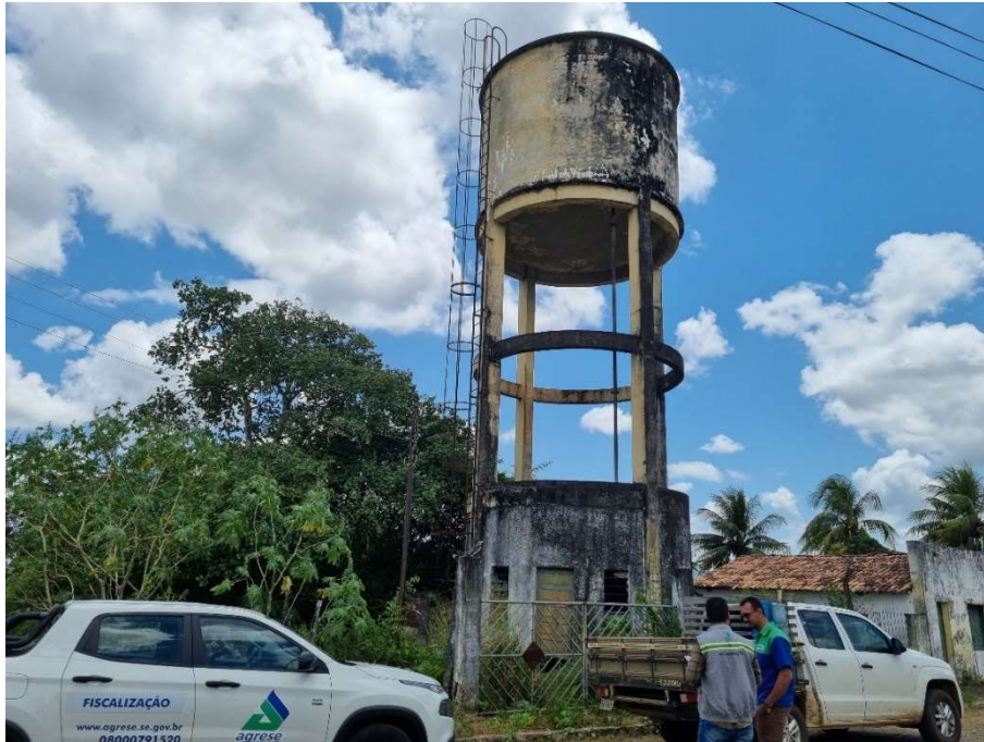
Imagem 3 – Sistema Simplificado – Pov. Lagoa Funda (Visão Geral).