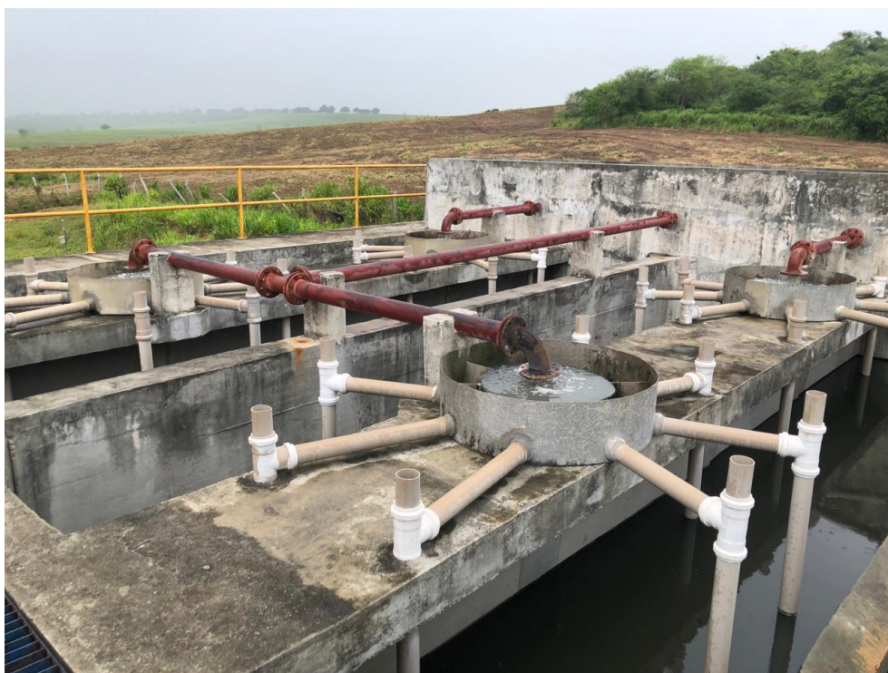
Imagem 6: Wetland – ETE São Francisco